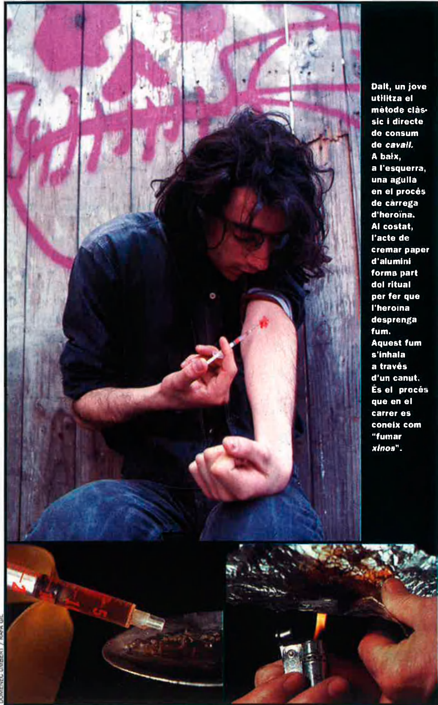
Dalt, un jove utilitza el mètode clàssic i directe de consum de cavall . A baix, a l'esquerra, una agulla en el procés de càrrega d'heroïna. Al costat, l'acte de cremar paper d'alumini forma part del ritual per fer que l'heroïna desprengui fum. Aquest fum s'inhala a través d'un canut. És el procés que en el carrer es coneix com "fumar xinos".

Al País Valencià, per exemple, dels quatre centres d'ajuda per a malalts que preveia el Pla Autònmic de Prevenció de Drogodependències, només n'hi ha un en funcionament, el de Castelló. Organitzacions com ara Médicos del Mundo o Proyecto Hombre són les que intenten omplir aquest forat, sense que l'administració es decideixi a dur la