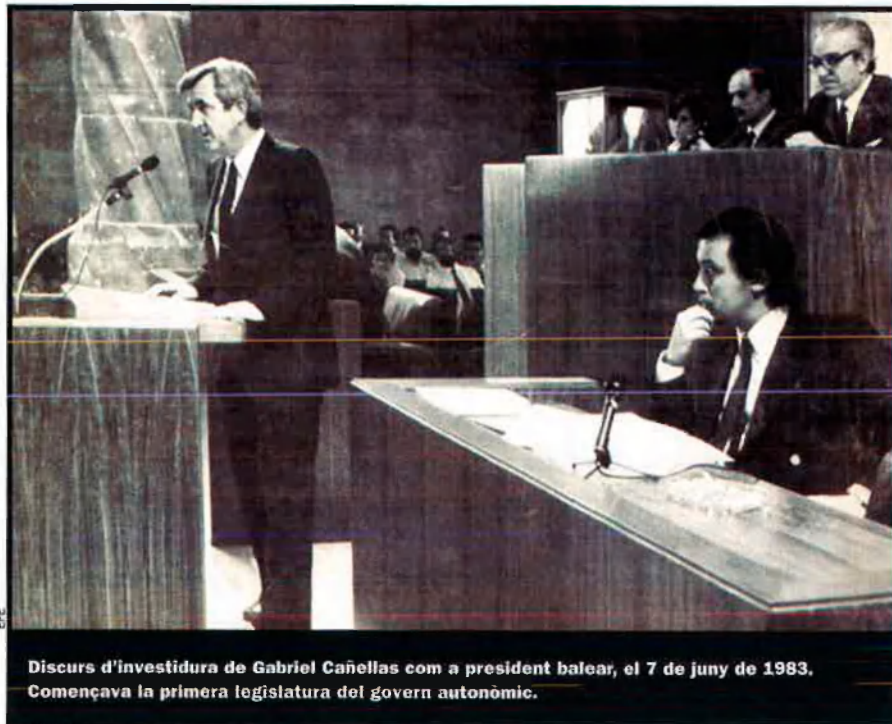
Discurs d'investidura de Gabriel Cañellas com a president balear, el 7 de juny de 1983. Començava la primera legislatura del govern autònom.