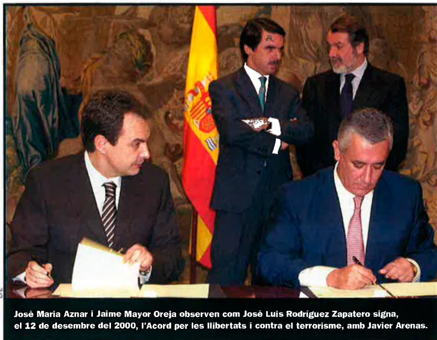
José María Aznar i Jaime Mayor Oreja observen com José Luis Rodríguez Zapatero signa, el 12 de desembre del 2000, l'Acord per les llibertats i contra el terrorisme, amb Javier Arenas.

L'avis del 23-F i la normalitat constitucional. El control del procés de la transició va arribar al seu punt més àlgid durant el cop d'estat del 23 de febrer del 1981. Una advertència que va fer encarrilar "pel bon camí" la política espanyola. Des d'aquell moment s'accen-