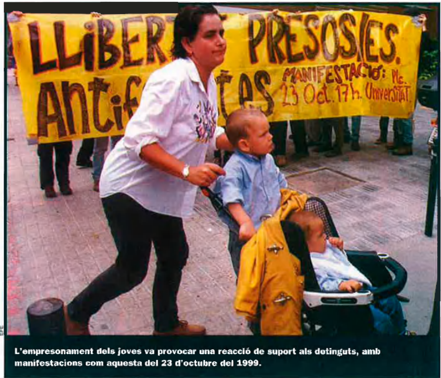
L'empresonament dels joves va provocar una reacció de suport als detinguts, amb manifestacions com aquesta del 23 d'octubre del 1999.