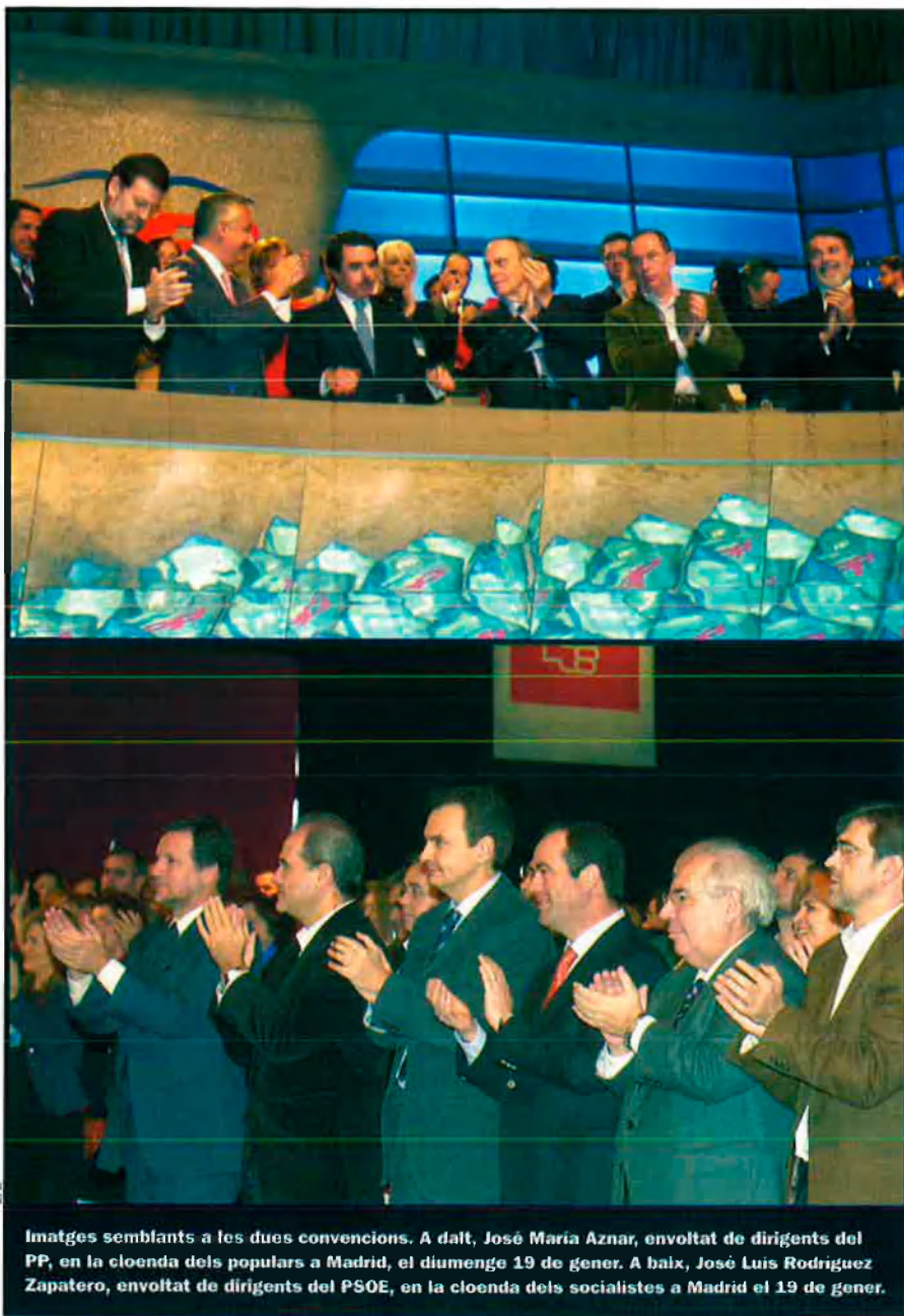
Imatges semblants a les dues convencions. A dalt, José María Aznar, envoltat de dirigents del PP, en la cloenda dels populars a Madrid, el diumenge 19 de gener. A baix, José Luis Rodríguez Zapatero, envoltat de dirigents del PSOE, en la cloenda dels socialistes a Madrid el 19 de gener.