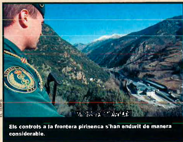
Els controls a la frontera pirinenca s'han endurit de manera considerable.

Les comarques de Lleida eren, doncs, una de les principals vies d'entrada del tabac il·legal des d'Andorra, per la qual cosa es va posar en marxa l'Operació Muntanya. El tràfic ha quedat reduït a la mínima expressió. Això s'ha notat fins i tot en les confiscacions. Així, l'any