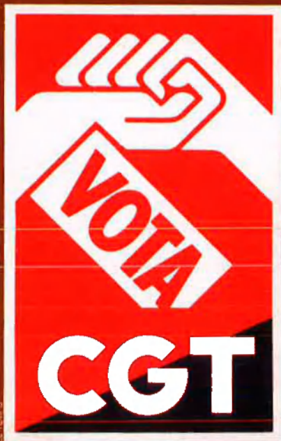
Pamflet electoral recent de la Confederació General de Treballadors - CGT.

intenció subversiva de l'organització però que estaven molt més a prop del sarau nocturn que de llevar-se de bon matí per anar a treballar a la fàbrica o a l'oficina. I, amb tot, aquestes descripcions dels elements que confluïren a la CNT a mitjan anys 70 no esgoten les diferències realment existents.