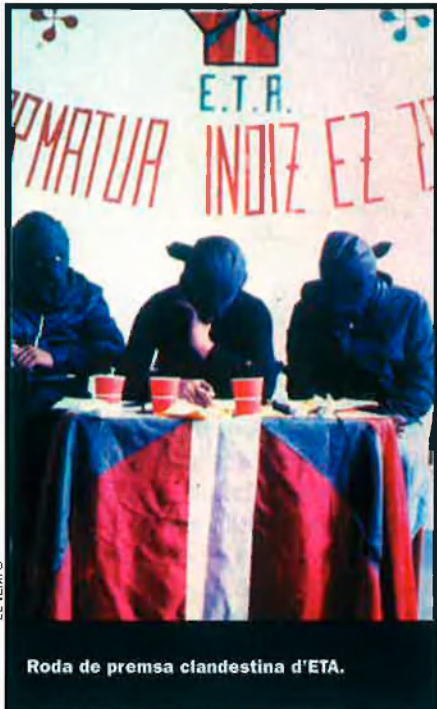
Roda de premsa clandestina d'ETA.

Mentrestant, ETA no deia res, però els fets demostraven el dia 24 de desembre que, de treva, res de res. Des que Marcos va fer la seva proposta hi va haver un atemptat a Santander, un enfrontament amb la Guàrdia Civil, les detencions de diverses persones acusades de pertànyer a ETA, la fuga d'una d'elles, i altres esdeveniments que llançaven molts mals auguris a una resposta positiva a la proposta de diàleg. Però per si no quedava clar, el passat 6 de gener el diari Gara publicava un comunicat d'ETA en què no només rebutjava la proposta de Marcos sinó que menyspreava qui l'havia fet. Ha estat una gerra d'aigua freda, però alhora reforça tots els que, inclosos els zapatistes, han defensat com han pogut la novinculació entre l'EZLN i ETA.