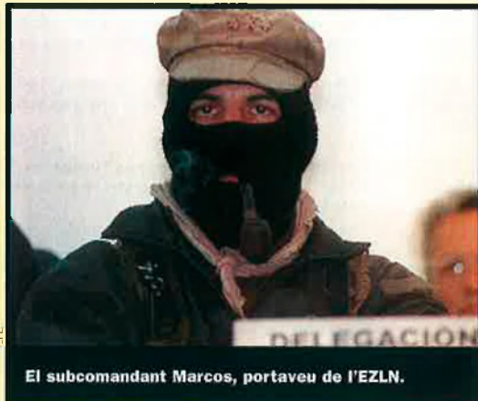
El subcomandant Marcos, portaveu de l'EZLN.

Sí, el clown Garzón ha declarado ilegal la lucha política del País Vasco. Después de hacer el ridículo con ese cuento engañoso de agarrar a Pinochet (que lo único que hizo es darle vacaciones con los gastos pagados), demuestra su verdadera vocación fascista al negarle al pueblo vasco el derecho de luchar políticamente por una causa que es legítima.