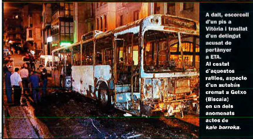
A dalt, escorcoll d'un pis a Vitòria i trasllat d'un detingut acusat de pertànyer a ETA. Al costat d'aquestes ratlles, aspecte d'un autobús cremat a Getxo (Biscaia) en un dels anomenats actes de kale borroka .