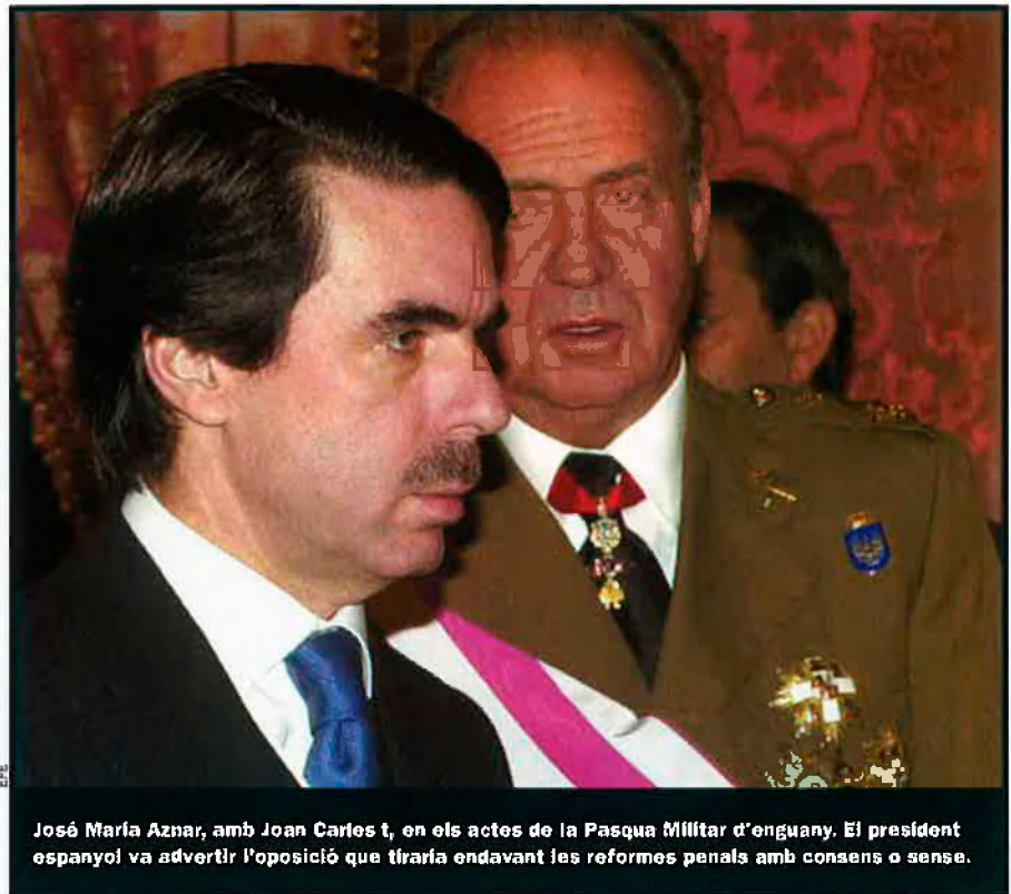
José María Aznar, amb Joan Carles I, en els actes de la Pasqua Militar d'enguany. El president espanyol va advertir l'oposició que tiraria endavant les reformes penals amb consens o sense.

Tot i així, les negociacions que faran aquestes dues formacions per a consensuar un text no seran senzilles. Serà en