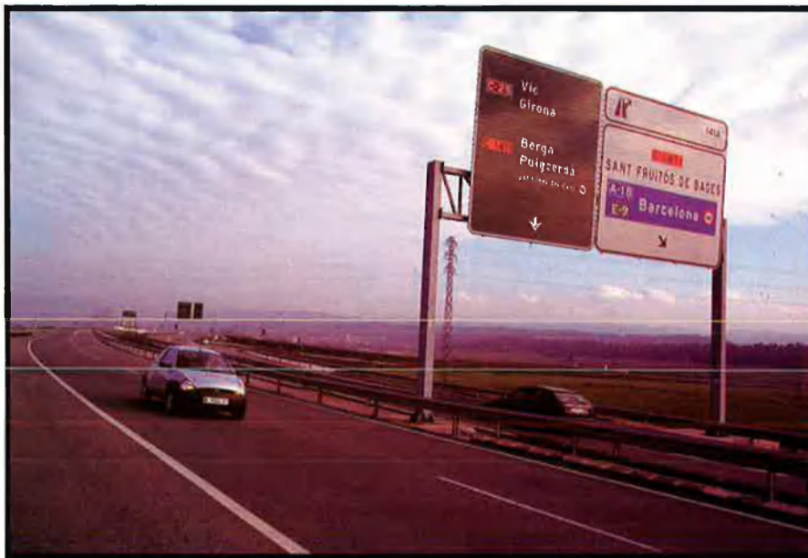
L'eix transversal ha millorat la relació entre Manresa i Vic. El desdoblament d'aquesta via ha estat una de les primeres reivindicacions conjuntes de les capitals del Bages i Osona.