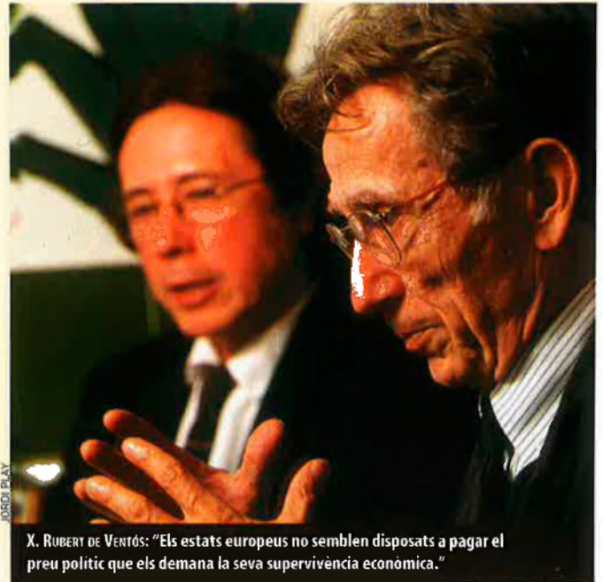
X. RUBERT DE VENTÓS: "Els estats europeus no semblen disposats a pagar el preu polític que els demana la seva supervivència econòmica."