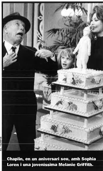
Chaplin, en un aniversari seu, amb Sophia Loren i una joveníssima Melanie Griffith.

Fugint del conservadorisme. Després de la Segona Guerra Mundial, Charles Chaplin és un personatge res-