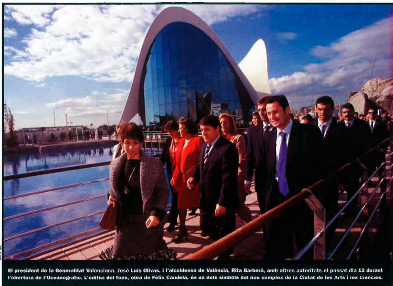
El president de la Generalitat Valenciana, José Luis Olivas, i l'alcalde de València, Rita Barberà, amb altres autoritats el passat dia 12 durant l'obertura de l'Oceanogràfic. L'edifici del fons, obra de Félix Candela, és un dels símbols del nou complex de la Ciutat de les Arts i les Ciències.

la Ciutat de les Arts va perdre l'any passat 36 milions d'euros. L'Hemisfèric i el Museu de les Ciències presenten saldos negatius i ni tan sols l'immens aparcament, que hauria de ser l'element més rendible de tot el complex, resulta beneficiós. Els problemes constants de finançament han provocat des de la constitució de la societat que gestiona la Ciutat de les Arts nombroses injeccions de fons. Aquesta complicada situació econòmica de Cacsà es detectava ja al 2000, quan la Generalitat va haver de salvar de la "fallida tècnica" la Ciutat de les Arts amb una ampliació de capital, una operació que va haver de repetir l'exercici passat.