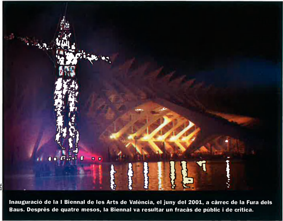
Inauguració de la I Biennial de les Arts de València, el juny del 2001, a càrrec de la Fura dels Baus. Després de quatre mesos, la Biennial va resultar un fracàs de públic i de crítica.

Com la Ciutat del Cinema, que els espots publicitaris de la Generalitat donen com acabada quan a hores d'ara les màquines encara estan treballant per aplanar el terreny. O com la primera edició de la Biennial de les Arts, que es va vendre com la més important d'Europa després de la de Venècia i que