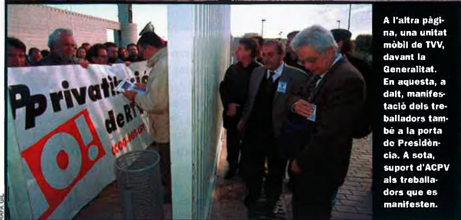
A l'altra pàgina, una unitat mòbil de TVV, davant la Generalitat. En aquesta, a dalt, manifestació dels treballadors també a la porta de Presidència. A sota, suport d'ACPV als treballadors que es manifesten.