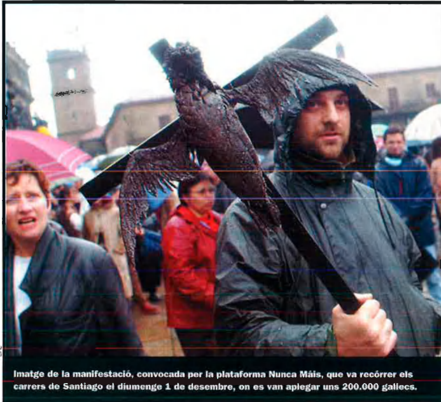
Imatge de la manifestació, convocada per la plataforma Nunca Más, que va recórrer els carrers de Santiago el diumenge 1 de desembre, on es van aplegar uns 200.000 gallecs.