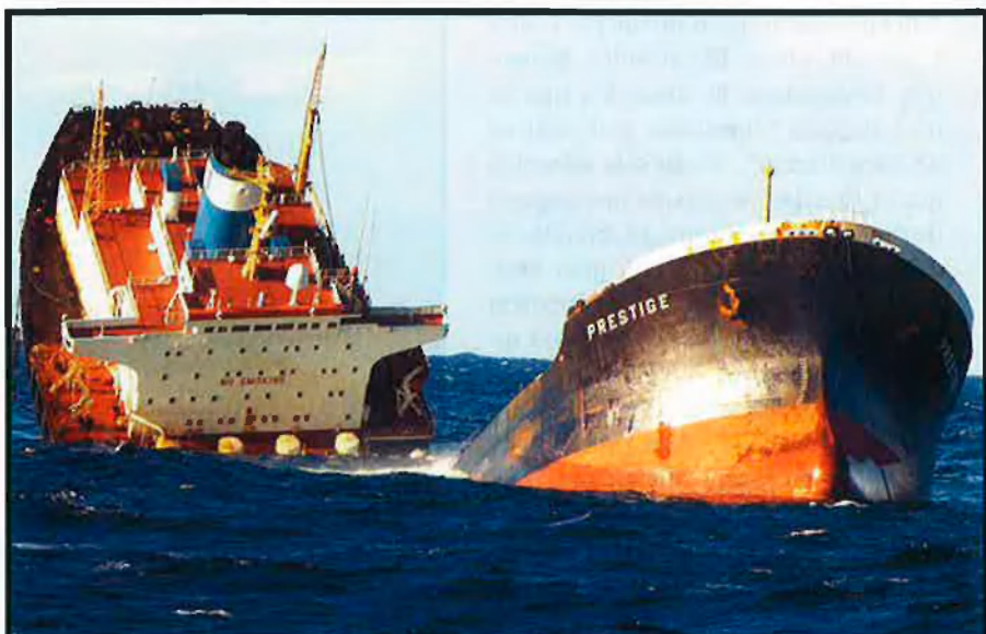
A dalt, el Prestige, enfonsant-se, el passat 19 de novembre. A sota, un voluntari que neteja la platja d’O Coido, a Muxia, mentre les ones segueixen arrossegant noves taques de petroli fins a la costa.

Desinformació. Però les autoritats espanyoles semblaven més preocupades a minimitzar la crisi i a desinformar l’opinió pública. Les dades sobre la situació i la magnitud de les taques continuen