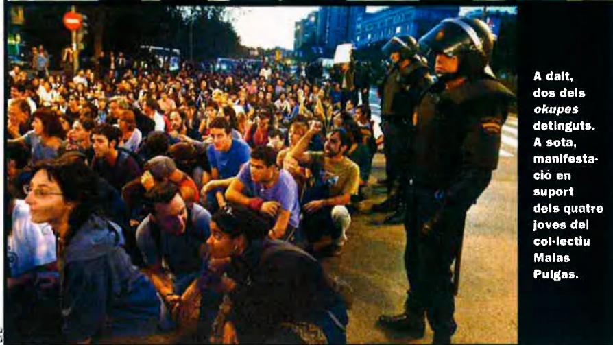
A dalt, dos dels okupes detinguts. A sota, manifestació en suport dels quatre joves del col·lectiu Malas Pulgas.