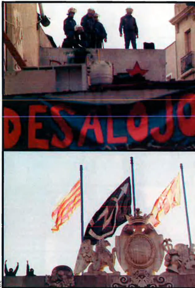
Diferents accions relacionades amb el moviment okupa. A dalt, esquerra, operació de desallotjament del cinema Princesa de Barcelona. A sota, una bandera okupa oneja en l'ajuntament de la capital catalana. A la dreta, un jove protesta penjant-se a Can Masdeu, a Collserola.