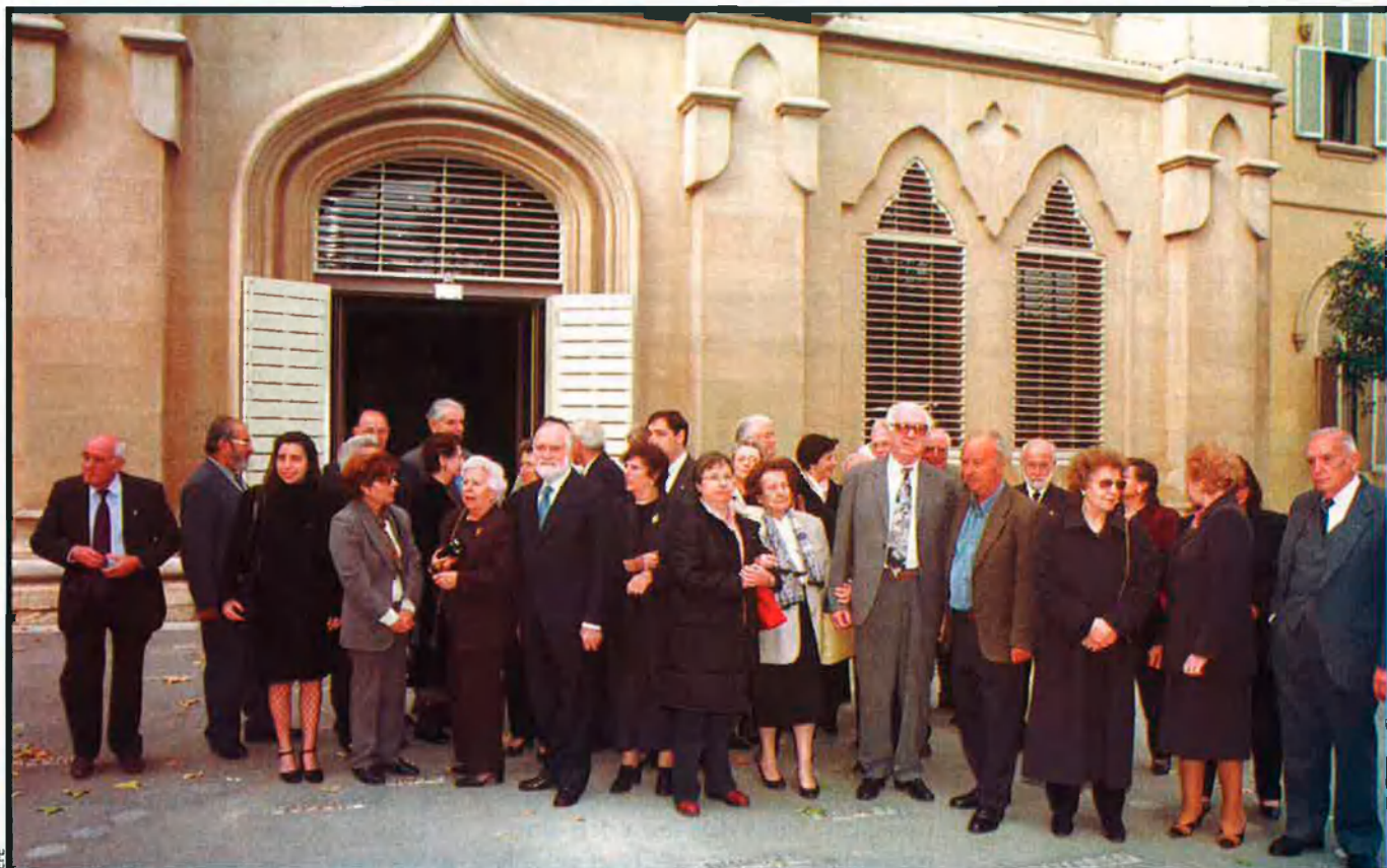
L'acte d'homenatge organitzat per la Universitat de Lleida als exiliats política va estar carregat d'emoció. Molts dels protagonistes no van poder evitar les llàgrimes durant el seu parlament.

bombardeig, conegut com el "Gernika de Lleida", perquè totes les víctimes van ser civils.