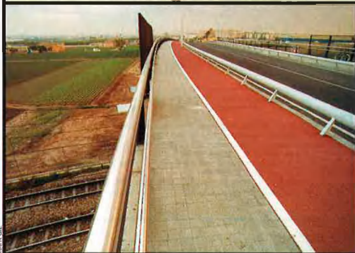
El barril de l'Empalme de Burjassot protesta contra els accessos que l'han aïllat i han impedit el soterrament de les vies. A baix, una vista de l'horta que queda des del nou pont. Al fons, a la dreta, la nau de Segura.

govern, la RTVV, el pla de "supressió de passos a nivell" continuava el seu ritme d'aplicació. Van eixir a exposició pública els plànols i començaren les expropiacions de terrenys. Els veïns de Burjassot van contemplar sorpresos com, una vegada més, la seua reivindicació de soterrar les vies del metro al pas per la localitat era oblidada i substituïda per una complicada xarxa de carreteres que tornava a ferir el terme sense oferir solucions reals al problema que representen els trens travessant cada quinze minuts el poble, per dues línies, en una direcció i l'altra. Hi hagué fins i tot una manifestació popular i una simbòlica plantada de creus en la zona condemnada a mort, però