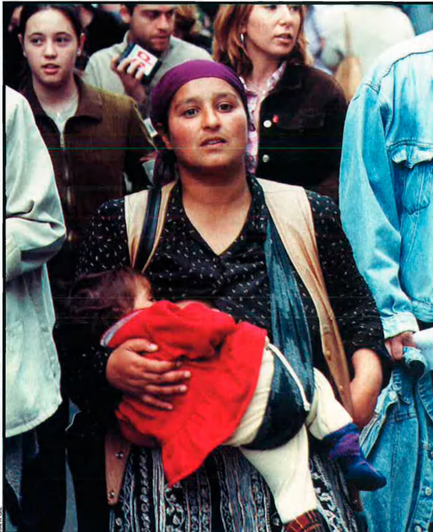
La mendicitat entre els immigrants romanesos és una activitat organitzada. La utilització de nens està molt perseguida, però continua practicant-se.

una campanya de propaganda que parlava molt bé d'Espanya, i que insistia a dir que a penes hi havia immigrants d'Europa, i que als que hi treballaven, se'ls tractava d'allò més bé." "En els dos països –recorda– ja hi havia molts rumans, i la relació amb els immigrants era molt tensa; la impressió que molts teníem era que l'Europa avançada volia repartir-se els immigrants de l'Europa més problemàtica."