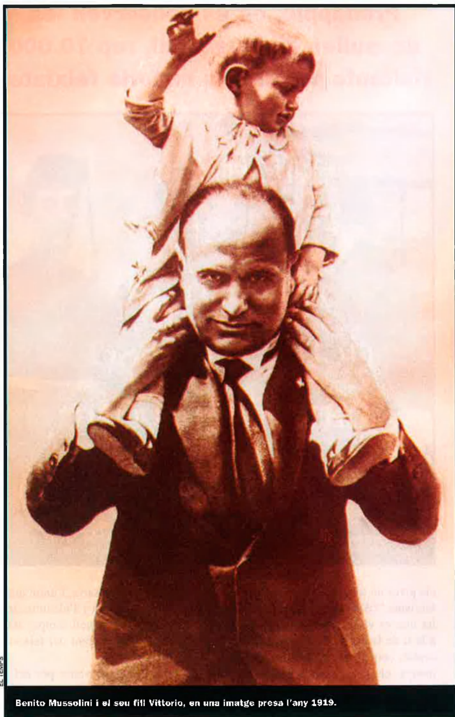
Benito Mussolini i el seu fill Vittorio, en una imatge presa l'any 1919.