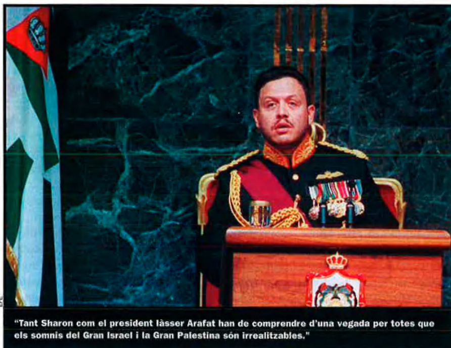
"Tant Sharon com el president Iàsser Arafat han de comprendre d'una vegada per totes que els somnis del Gran Israel i la Gran Palestina són irrealitzables."

Israel ha fet saber que transferirà 400 milions de dòlars provinents de recaptacions tributàries palestines que, en tot cas, ja havien vençut fa molt de temps.