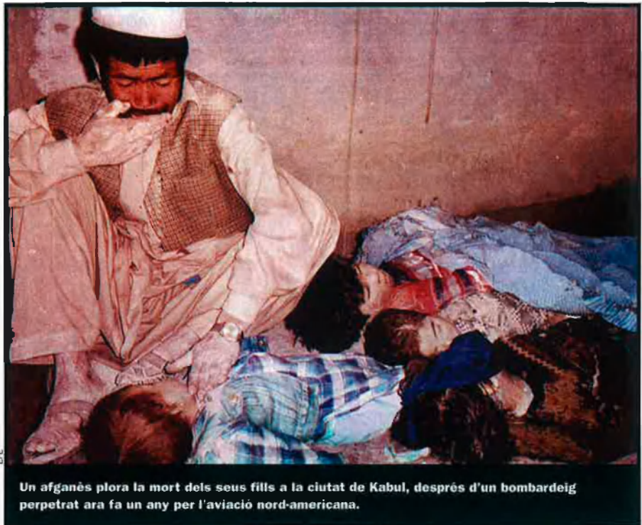
Un afganès plora la mort dels seus fills a la ciutat de Kabul, després d'un bombardeig perpetrat ara fa un any per l'aviació nord-americana.