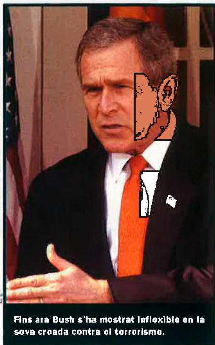
Fins ara Bush s'ha mostrat inflexible en la seva croada contra el terrorisme.

Sens dubte, molts d'aquests terroristes van ser reclutats per la seva por als EUA i pel desig que canviés la política exterior nord-americana. Probablement, alguns d'ells tenien una forta consciència política pel simple fet de pertànyer a una nació, com podria ser el cas de palestins o d'iraquians. Altres podrien interessar-se per temes menys concrets i estar molestos per la invasió de tropes americanes en el seu país. Però si del que parlem és dels líders d'Al-Qaida, dels que planegen i diri-