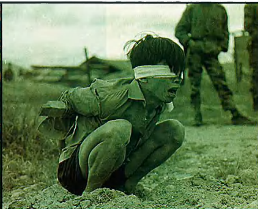
A l'esquerra, la manifestació del passat 26 d'octubre a Washington, en què diversos manifestants van fer el signe de la pau prop de la Casa Blanca. A la dreta, un presoner vietnamita és torturat mentre l'interroguen les forces nord-americanes, l'any 1967.

eren "milers de manifestants", però després de rebre diverses queixes va rectificar públicament i va ampliar la informació sobre les diverses protestes que s'havien fet aquest dia arreu del país.