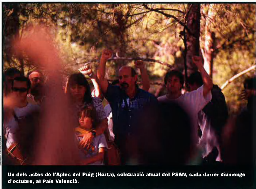
Un dels actes de l'Aplec del Pulg (Horta), celebració anual del PSAN, cada darrer diumenge d'octubre, al País Valencià.

En qualsevol cas, el grup maoista més influent als Països Catalans en aquests anys va ser Bandera Roja. Creat en cercles universitaris el 1968, a partir de la mateixa escissió del PSUC que havia donat lloc al PCE (i), Bandera Roja es caracteritzà sobretot per la seva capacitat d'adaptació a formes d'organització més obertes que les habituals en els partits comunistes d'aquella època. A partir del nucli universitari inicial anà ampliant el seu abast incorporant grups de sindicalistes, catòlics i d'estudiants. Entre els seus dirigents sobresortiren el seu màxim teòric, Jordi Solé Tura –autor, entre d'altres, d'un voluminós text Sobre el revisionismo en España –, Jordi Borja i Alfons Carles Comín. Va estar al darrere de l'organització per sectors de les CCOO, que tingué una influència especial al Baix Llobregat. En tot cas, el seu èxit més important l'aconseguí en la promoció del moviment veïnal. L'any 1973,