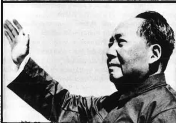
A dalt, Fidel Castro en una imatge de la revolució cubana. A l'esquerra, Mao Zedong, líder comunista xinès, en una de les seves intervencions davant del poble. Bona part dels grups esquerrans antifrancistes es van emmirallar en aquestes dues figures.