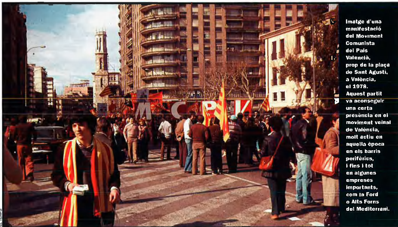
Imatge d'una manifestació del Moviment Comunista del País Valencià, prop de la plaça de Sant Agustí, a València, el 1978. Aquest partit va aconseguir una certa presència en el moviment veïnal de València, molt actiu en aquella època en els barris perifèrics, i fins i tot en algunes empreses importants, com la Ford o Alts Forns del Mediterrani.

ment Mao Zedong a Catalunya va ser la del PCE (internacional). Aquest havia sorgit del PSUC a partir de l'escissió l'any 1967 del grup aplegat entorn de la publicació Unidad . Els procés de formació del PCE (i) havia estat llarg i laboriós, i no es va constituir fins el 1969. La seva mateixa existència va ser també molt accidentada, ja que la marxa d'alguns dirigents l'any 1971 i la repressió el deixaren inactiu força temps. El 1975, abandonà la seva estratègia revolucionària, ingressà en l'Assemblea de Catalunya i es transformà en el Partit del Treball d'Espanya. Malgrat la seva important militància i suport electoral, el PTE no aconseguí mai representació parlamentària pròpia. Ni l'any 1977, quan es presentà en coalició amb Esquerra Republicana de Catalunya, ni més endavant, quan ho féu amb l'Organització Revolucionària de Treballadors, un altre grup maoista sorgit de la radicalització de grups cristians però amb poca implantació a Catalunya, i a Mallorca, on aterrà el 1976. Només al País Valencià l'ORT (Organització Revolucionària dels Treballadors) assolí certa importància a la Universitat, on es mostrà batalladora i molt crítica amb la resta de grups radicals, qüestionà que feia