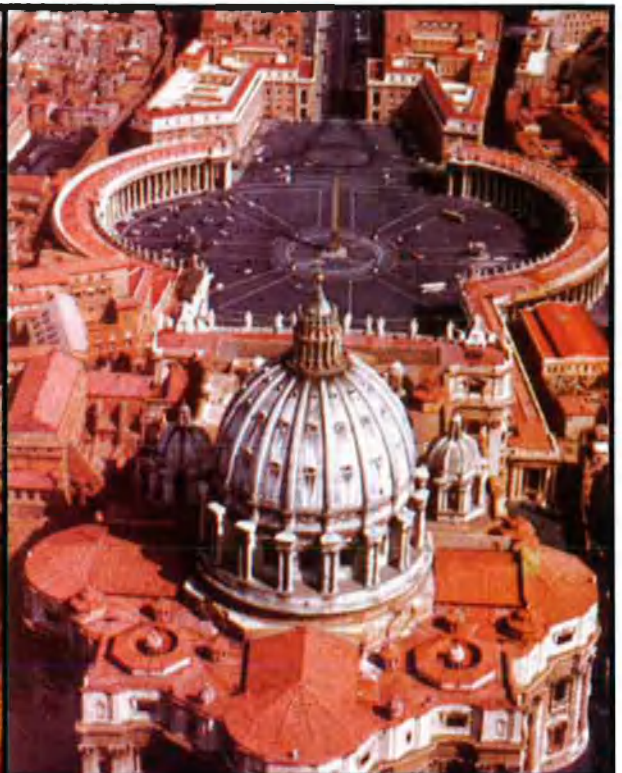
Dalt a l'esquerra, un detall del bou, símbol dels Borja, que es troba a la fortalesa de Civita Castellana. A l'esquerra, pintura dels apartaments Borja on destaca la figura d'Alexandre VI, una de les imatges més conegudes del segon papa Borja. Sobre aquestes ratlles, vista aèria de la basilica i de la plaça de Sant Pere i de la Via de la Conciliazione, rèplica amplificada de la via Alexandrina que Roderic de Borja va inaugurar el 24 de desembre de 1499.