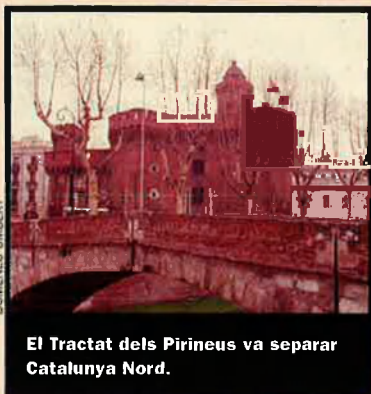
El Tractat dels Pirineus va separar Catalunya Nord.

L'IEC va començar aquest procés la primavera passada en fer un estudi sobre tots els punts en què l'estat francès no havia respectat el territori basant-se en el Tractat dels Pirineus.