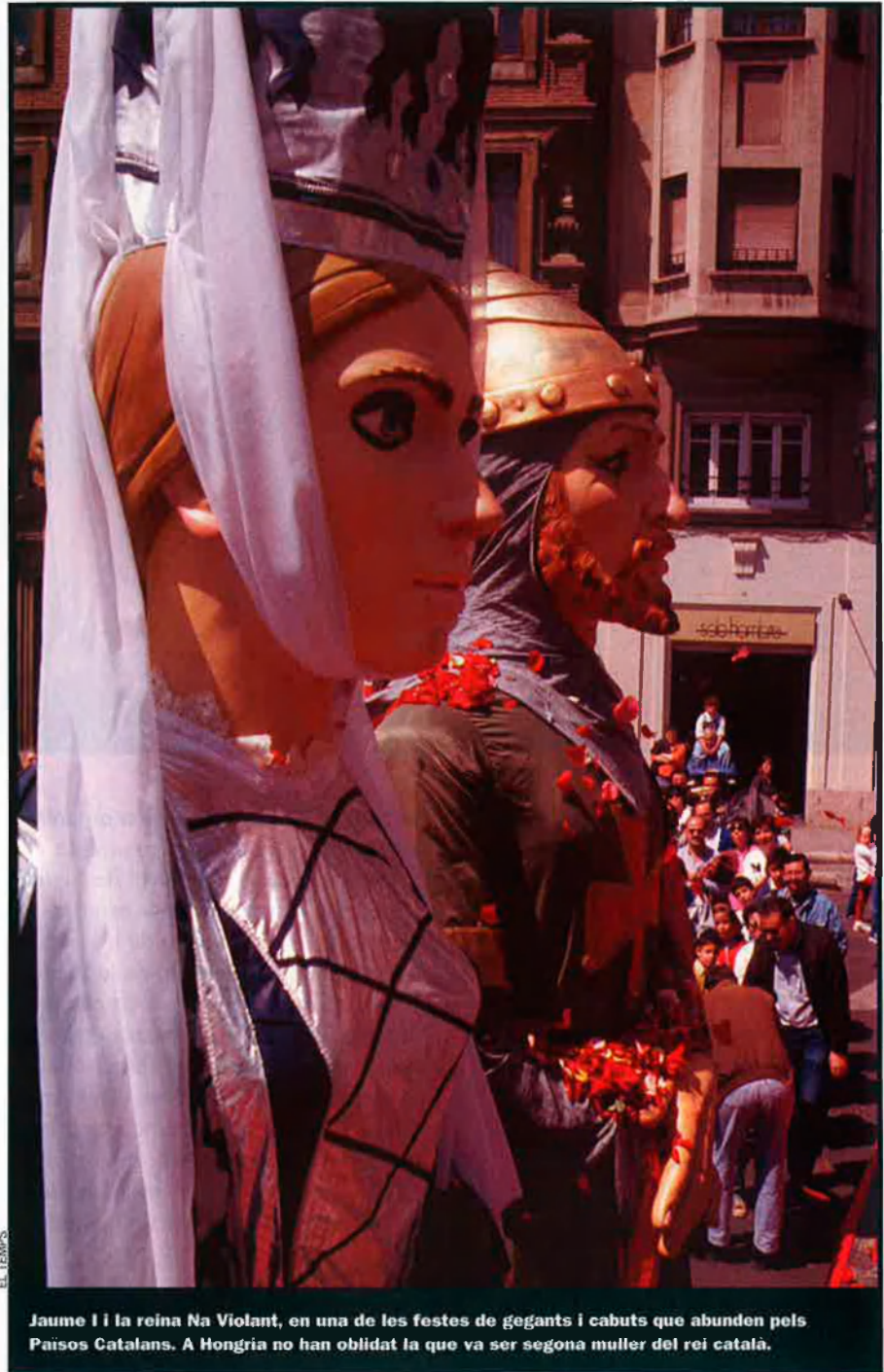
Jaume I i la reina Na Violant, en una de les festes de gegants i cabuts que abunden pels Països Catalans. A Hongria no han oblidat la que va ser segona muller del rei català.

La notícia del finançament de la tomba de la reina Violant per part del Govern d'Hongria es va conèixer dos mesos abans que se celebrés una festa a la Seu Vella de Lleida per commemorar el 750è aniversari de la firma de Jaume I de la carta fundacional de la ciutat de Castelló de la Plana, que va tenir lloc al castell de la Suda. L'any 1251 el rei Jaume I el Conqueridor va firmar a Lleida la carta de població que permetia als habitants del castell de Castelló traslladar-se a la plana (per això el nom de la ciutat). Tot i l'autorització reial signada per Jaume I, el canvi d'ubicació no es va fer fins al tercer dissabte de Quaresma de l'any 1252, per la qual cosa, encara que Castelló ja ha celebrat l'efemèride, el final de la festa dels 750 anys s'ha reservat per a l'any 2002. La comissió organitzadora de l'aniversari de Castelló de la Plana va fer cap a Lleida el passat 7 de setembre, i va promoure un acte d'homenatge al rei Jaume I. Tal com va destacar en l'homenatge Carme Vidal, directora de l'Institut d'Estudis Ilerdencs (IEI), la celebració també va servir per recordar la història que ens agermana. El programa de la commemoració va alternar el protocol amb els actes més populars. Castelló de la Plana va deixar constància de la celebració amb el lliurament a Lleida d'una placa commemorativa de ceràmica, que s'instal·larà al castell de la Suda, un cop aquest monument estigui restaurat, amb la finalitat que la memòria d'a-