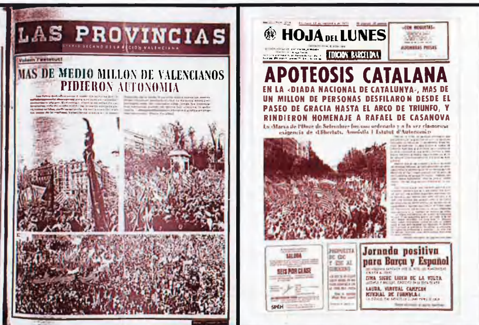
A l'esquerra, convocatòria de la manifestació del 9 d'octubre de 1977 a València. L'assistència a les concentracions de València i de Barcelona va ser massiva. La premsa se'n va fer ressò.