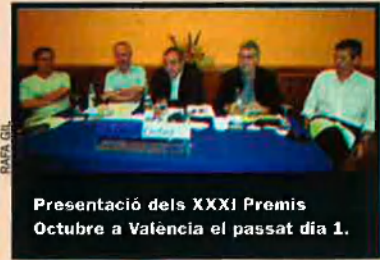
Presentació dels XXXI Premis Octubre a València el passat dia 1.

La XXXI edició dels tradicionals Premis Octubre, que se celebrarà a València del 21 al 26 d'octubre, dedicarà un dels seus congressos a la figura de l'escriptor català Jacint Verdaguier en complir-se cent anys de la seua mort. Escriptors i estudiosos de l'obra verdaguieriana analitzaran la trajectòria d'aquest autor just en un moment que al País Valencià la Conselleria d'Educació ha eliminat qualsevol al·lusió als autors catalans i balears dels temaris de secundària.