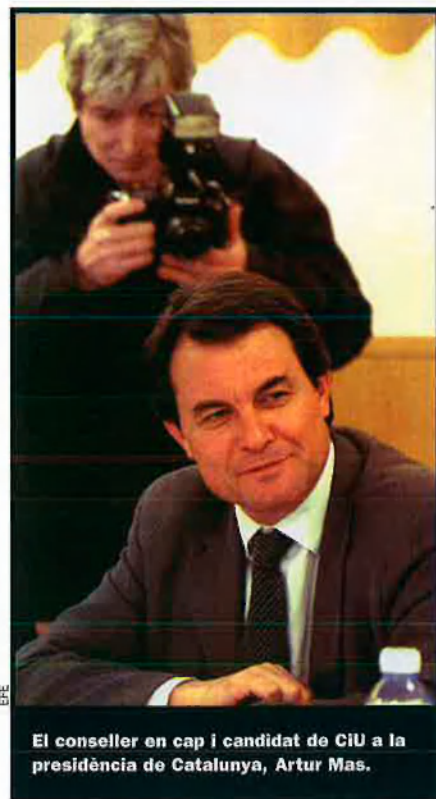
El conseller en cap i candidat de CiU a la presidència de Catalunya, Artur Mas.

La marxa d'Esteve de CDC no ha generat cap moviment de mimetisme, ni en l'anomenat sector dels "sobiranistes"