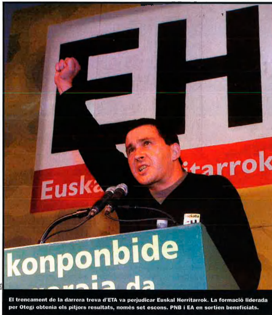
El trencament de la darrera treva d'ETA va perjudicar Euskal Herriarrok. La formació liderada per Otegi obtenia els pitjors resultats, només set escons. PNB i EA en sortien beneficiats.