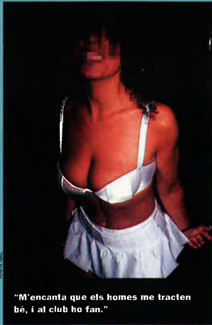
“M'encanta que els homes me tracten bé, i al club ho fan.”

Compatibilitza les jornades al club amb caps de setmana amb un o altre client. “Jo preferisc els vells”, diu, “són simpàtics, i t'estan agraïts, i a mi