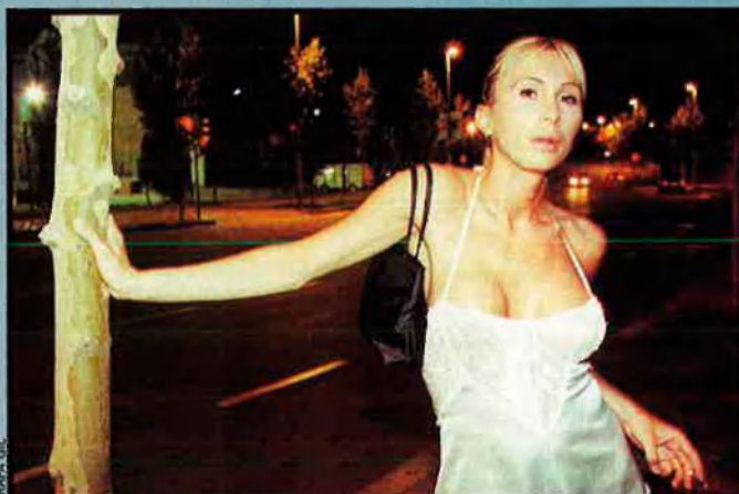
ELS TRANSVESTITS NO PODEN ACCEDIR ALS CLUBS. APARTAR-LOS DEL CARRER EXIGEIX DONAR-LOS SOLUCIONS ECONOMIQUES ALTERNATIVES.

Un policia li va contar que prompte els llevaran del carrer, que el reglament entrarà en vigor a finals d’any, i ell haurà de desaparèixer. “No em va saber dir si la llei mos afecta o és només per a dones; dels xaperos de l’estació d’autobusos i del vell lilit del Túria, ningú en diu res. Què passa, que ells o jo no mengem? En nosaltres no pensa ningú?” Fuma i fuma, i continua preguntant-se en veu alta: “Per a que una nit me vaja bé, he de xuclar-la cinc o sis vegades; sense cinc clients no mengem ni pague el lloguer ni me compre la roba; no hi ha clubs per a transvestits; a mi, si me lleven del carrer, o me mantenen els polítics, o fan puticlubs només per a transvestits.” “Tindrè que