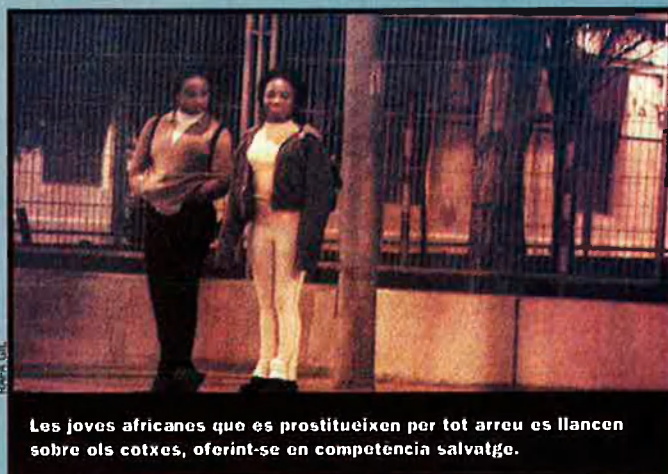
LES JOVES AFRICANES QUE ES PROSTITUEIXEN PER TOT ARREU ES LLANCEN SOBRE ALS COTXES, OFERINT-SE EN COMPETENCIA SALVATGE.

Com puc, li explico a la menor —que, com la resta, segurament ha de pagar el bitllet que l’ha duta ací des de Nigèria, i això la lliga, amb l’ajuda d’un ritu vudú, als mafiosos que l’han transportat— el que vol fer la Generalitat. Em costa. A ella li costa d’entendre, i de contestar. Al final, em diu.