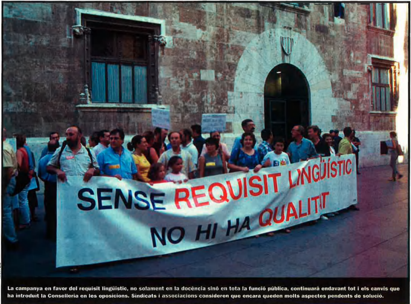
La campanya en favor del requisit lingüístic, no solament en la docència sinó en tota la funció pública, continuarà endavant tot i els canvis que ha introduït la Conselleria en les oposicions. Sindicats i associacions consideren que encara queden molts aspectes pendents de solució.

els interessos corporatius, no solament en el cas del requisit lingüístic, sinó en totes les qüestions que ens puguen afectar a més llarg termini." Aquest col·lectiu té previstes algunes mobilitzacions amb l'objectiu que, si no ho fa la Conselleria, almenys els tribunals els reconeguen el dret a presentar-se a les oposicions.