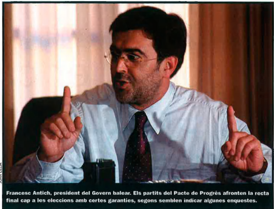
Francesc Antich, president del Govern balear. Els partits del Pacte de Progrés afronten la recta final cap a les eleccions amb certes garanties, segons semblen indicar algunes enquestes.

Tot i que sembla que s'han fet moltes enquestes, favorables segons la font que les ha encarregat, el fet és que l'única de què es té constància és la que el Govern balear encarrega cada any, i que enguany es va fer al maig i juny passat. L'executiu només ha informat de resultats globals sobre preguntes valoratives, però no sobre la intenció de vot. Aquest setmanari ha pogut conèixer les característiques generals del resultat del sondeig de dos partits.