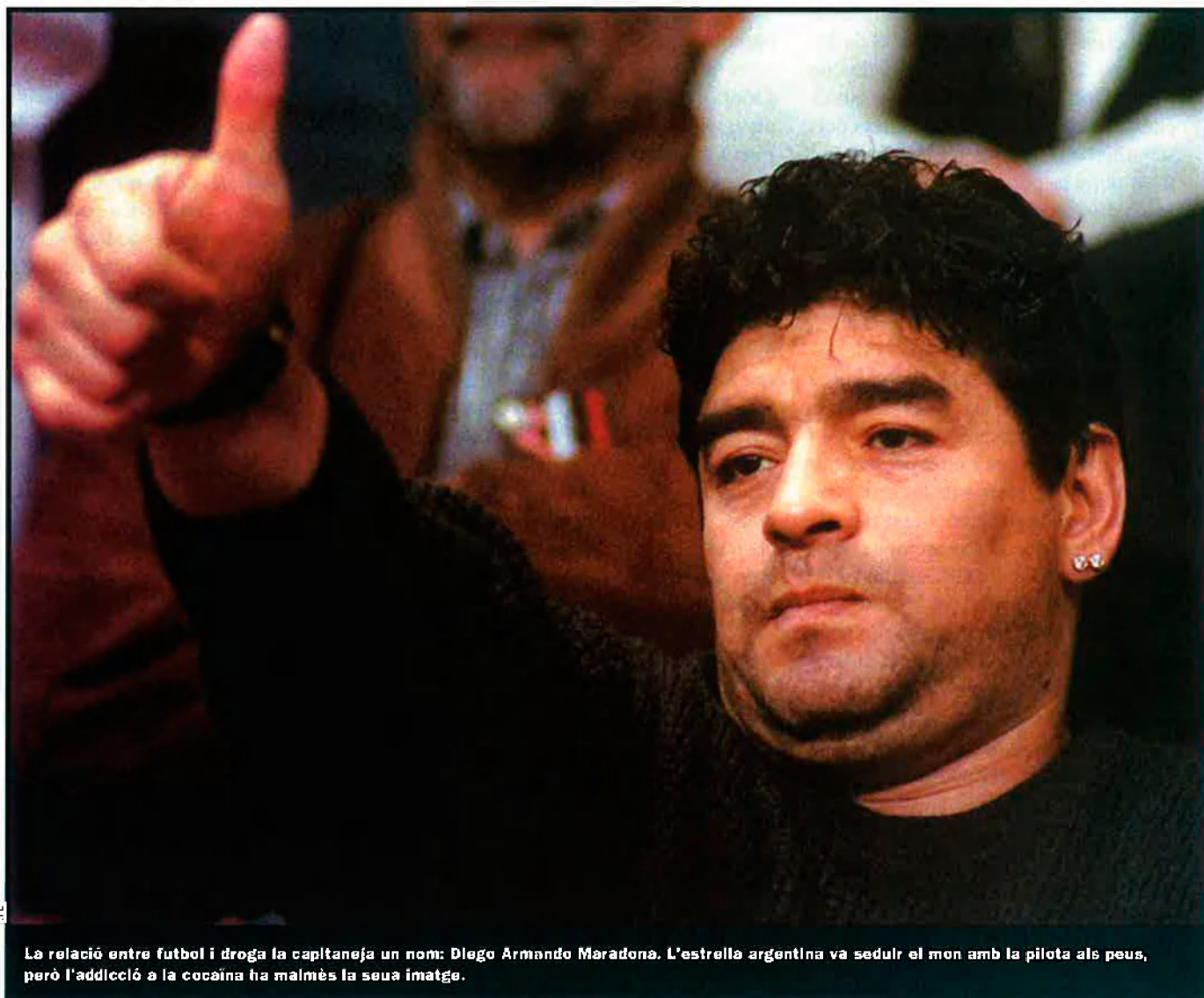
La relació entre futbol i droga la capitaneja un nom: Diego Armando Maradona. L'estrella argentina va seduir el món amb la pilota als peus, però l'addicció a la cocaïna ha malmès la seua imatge.

Sembla també que un company seu, el lateral esquerre Julio Alberto, va introduir-se en l'infern de la droga de la mà de Maradona, encara que no ho ha reconegut públicament. Anys després de la seua retirada del futbol, Julio Alberto va comparèixer en diversos programes televisius explicant que la seua addicció a la cocaïna li va arruïnar la vida i que havia malbaratat una fortuna propera als 500 milions de pessetes (3 milions d'euros). L'últim episodi del seu tortuós camí per la cara fosca de l'èxit el va protagonitzar aquest estiu, quan va destrossar el mobiliari de l'habitació d'un hotel de Barcelona on s'allotjava i va intentar suïcidar-se després d'haver consumit drogues i alcohol en grans quantitats.