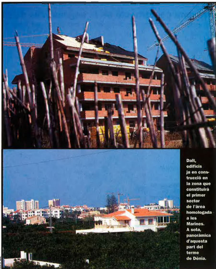
Dalt, edificis ja en construcció en la zona que constituirà el primer sector de l'àrea homologada a les Marines. A sota, panoràmica d'aquesta part del terme de Dénia.

Els Verds, per la seua banda, han presentat una denúncia a la direcció general de Medi Ambient de la Unió Europea, al Parlament Europeu i a l'Ombudsman perquè consideren que l'homologació de les Marines entra en contradicció amb diverses directives europees. “Homologar simplement una part de Dénia de la segona línia de platja i arrassar més de quatre milions quadrats de zona arbòria i hortícola, i d'aquesta manera deixar de banda les mancances d'aigua i d'energia que pateix el municipi i la necessitat d'un informe d'impacte ambiental, no és una solució, i, a més a més, entra en contradicció amb la directiva europea sobre l'avaluació d'impacte ambiental”, constaten en aquesta denúncia. També critiquen que, entre d'altres perjudicis, la construcció dels nous habitatges agreujaria els problemes de trànsit, cada vegada més importants a la ciutat: “La falta de mitjans de transport