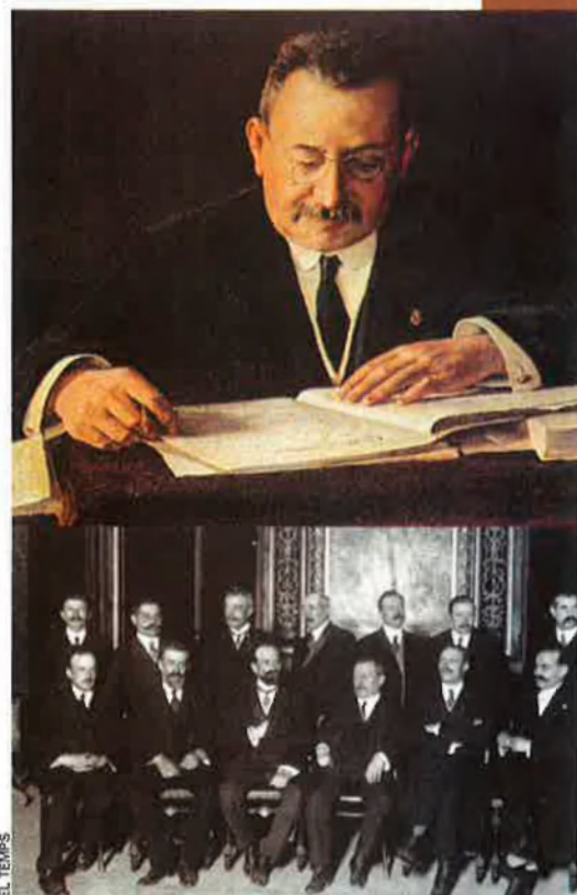
Enric Prat de la Riba era el representant de la “Catalunya endins”. A la imatge de sota, reunit amb els consellers de la Mancomunitat de Catalunya i els parlamentaris catalans (Prat és el quart per l’esquerra de la filera de baix).

A la pàgina anterior, un instant de l’Assemblea de Parlamentaris catalans esdevinguda el 5 de juliol de 1917, a la sala del consistori nou de l’Ajuntament de Barcelona.