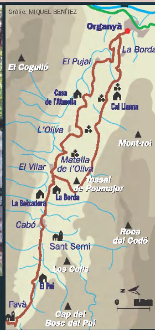
Aquesta ruta permet conèixer els set dòlmens que hi ha a la vall de Cabó.

final del trajecte, la font de la Caixa, sota l'ombra dels pollancre, és un paratge tranquil que convida a reposar.