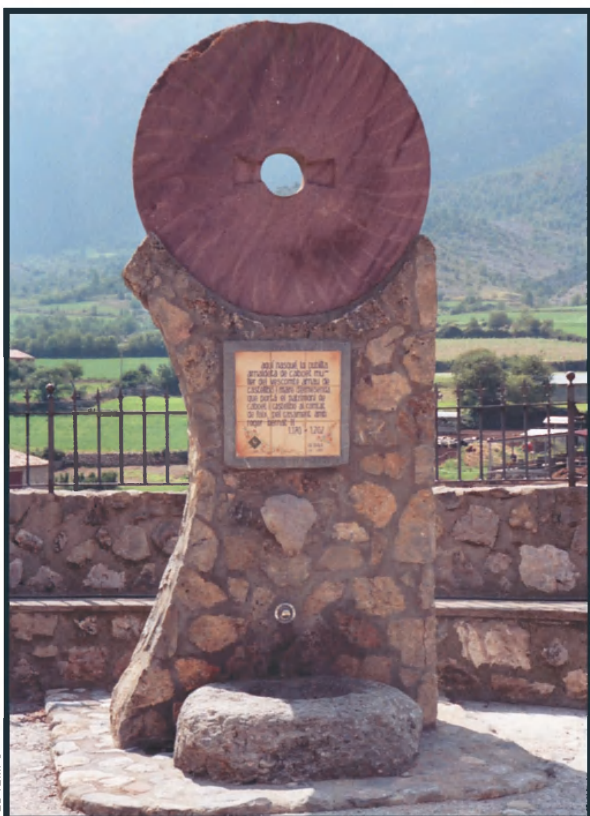
Monument dedicat a Arnaldeta de Caboet, noble nascuda el 1170 i compromesa amb la causa dels càtars.