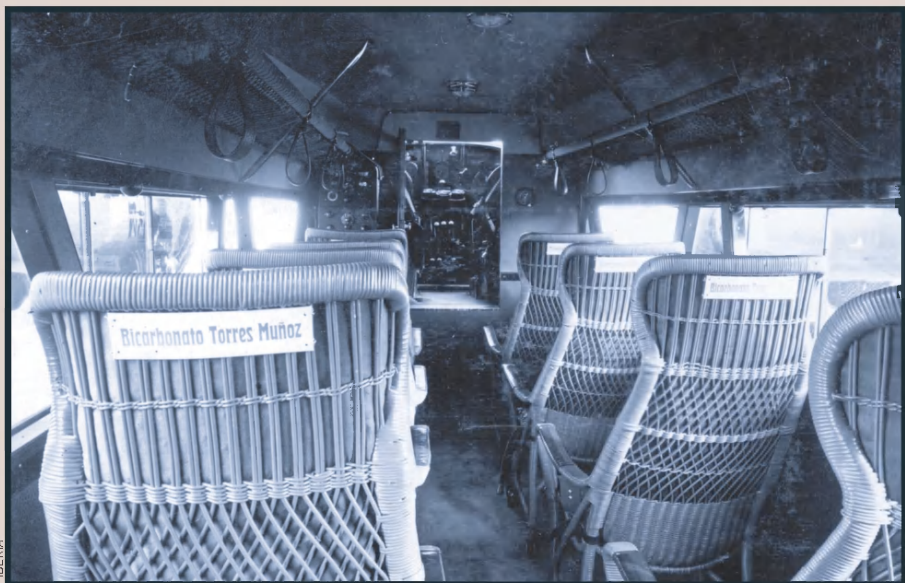
Cabina de passatgers dels Roland Rohrbach VIII, adquirits el 1927 per Luft Hansa.

El 25 de juliol de 1926, la Lliga comprà un avió Hanriot HD-13, però, com que no tenien pilot, s'acordà amb Empreses