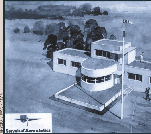
SINCEA / EPAC / ADR

davant, les Balears tenien enllaç amb França i l'Alger, però no amb la península.