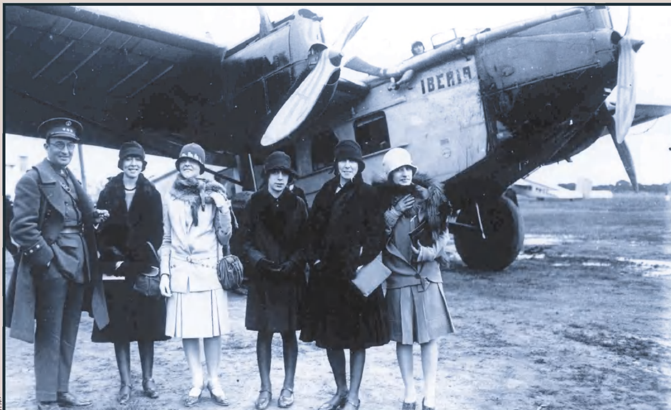
El capità general de Catalunya i unes dames posen davant el trimotor Roland Rohrbach VIII d'Iberia el dia de la inauguració de la línia Barcelona-Madrid, el 15 de desembre de 1927. S'hi pot apreciar el cap del pilot i la cabina dels passatgers.

Per als vols entre Barcelona i Madrid s'adquiriren tres avions Roland Rohrbach VIII, i, a diferència de UAE, només va contractar pilots alemanys. Aquests aparells trimotors, metàl·lics, tenien capacitat per a deu passatgers, lavabo, i dos tripulants que anaven en cabina oberta. Els avions anaven propulsats per tres motors BMW de 250 CV que li donaven una velocitat de creuer de 170 km/h.