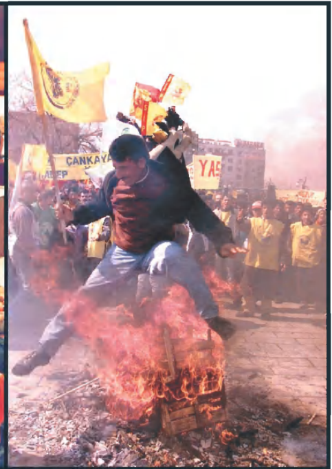
El Parlament turc va aprovar un seguit de mesures, com un reconeixement dels kurds (foto dreta), destinades a aconseguir que la Unió Europea permeti a Turquia ser designada oficialment candidata a l'adhesió.

Així, l'obertura de cursos de llengua kurda serà reglamentada pel Ministeri d'Educació, cercle tradicionalment oposat a qualsevol canvi en aquest sentit. Quant a les emissions de ràdio i televisió en kurd, aquestes seran sotmeses al control estricte del Gran Consell per l'audiovisual (RTUK), organisme que ha interpretat tradicionalment en un sentit restrictiu les directrius que asseguren els principis fundadors de la República: "una sola llengua, un sol poble".