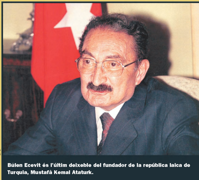
Bülent Ecevit és l'últim deixeble del fundador de la república laica de Turquia, Mustafà Kemal Atatürk.