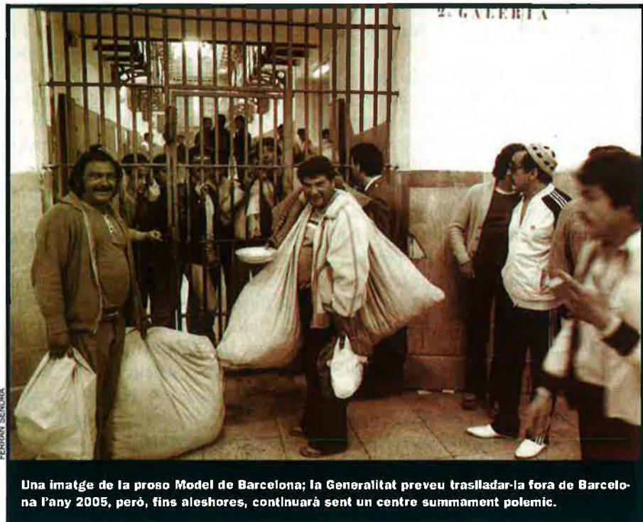
Una imatge de la presó Model de Barcelona; la Generalitat preveu traslladar-la fora de Barcelona l'any 2005, però, fins aleshores, continuarà sent un centre summament polemic.

Picassent és un bon exemple d'això. Finalment, s'ha convertit en l'espill que torna la mirada a les altres presons, tot i que en un sentit absolutament contrari al