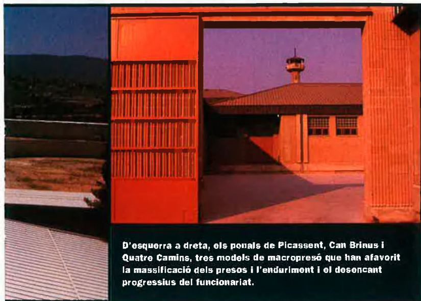
D'esquerra a dreta, els penals de Picassent, Can Brinus i Quatre Camins, tres models de macropresó que han afavorit la massificació dels presos i l'enduriment i el desencant progressius del funcionari.

seues possibilitats econòmiques, ha estat un reclam ascendent per a un tipus de delinqüència especialitzada en robatoris o extorsions que no deixa de créixer. Encara que la policia pateix un dèficit de personal, la tecnificació dels seus serveis i l'augment de la coordinació entre les forces de seguretat en els darrers deu anys ha provocat un creixement constant en la detenció d'integrants de bandes organitzades.