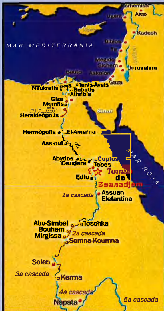
Mapa de situació de la tomba, prop de Tebes. A dalt, foto d'Eduard Toda disfressat de faraó; i, a baix, unes pintures de la tomba fotografiades pel mateix Toda.