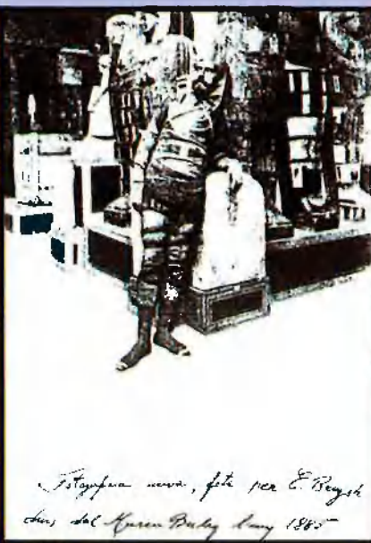
Togafara mumm, foto per E. Beyghel dans del Museu Bulaq l'any 1885