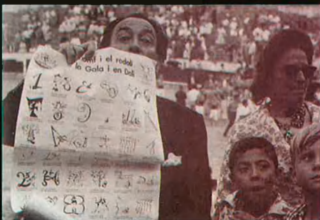
D'esquerra a dreta, i de dalt a baix, algunes imatges que palesen l'estreta relació existent entre Carles Fages de Climent i Salvador Dalí: Fages i Dalí, amb Josep Martí Roca, a Portlligat, als anys seixanta; una carta inèdita de Dalí a Fages; el mateix Dalí mostra l'auca que li dedica Fages a la plaça de braus de Figueres, l'any 1961; i el poema de Fages "El Crist de la Tramuntana" va inspirar aquest oli al genial pintor.