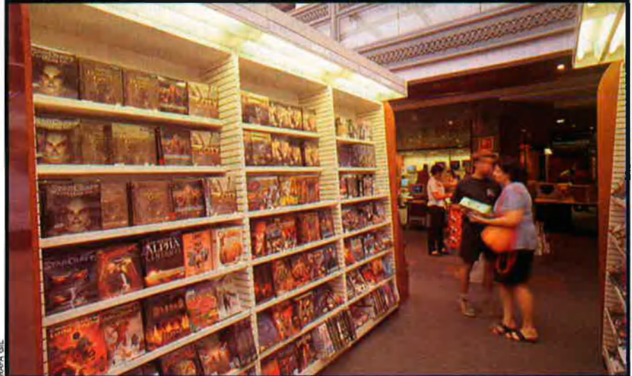
Els videojocs no produeixen epilèpsia, com es va arribar a dir, i l'agressivitat que provoquen les propostes més violentes tampoc no té efectes més enllà del temps del joc.