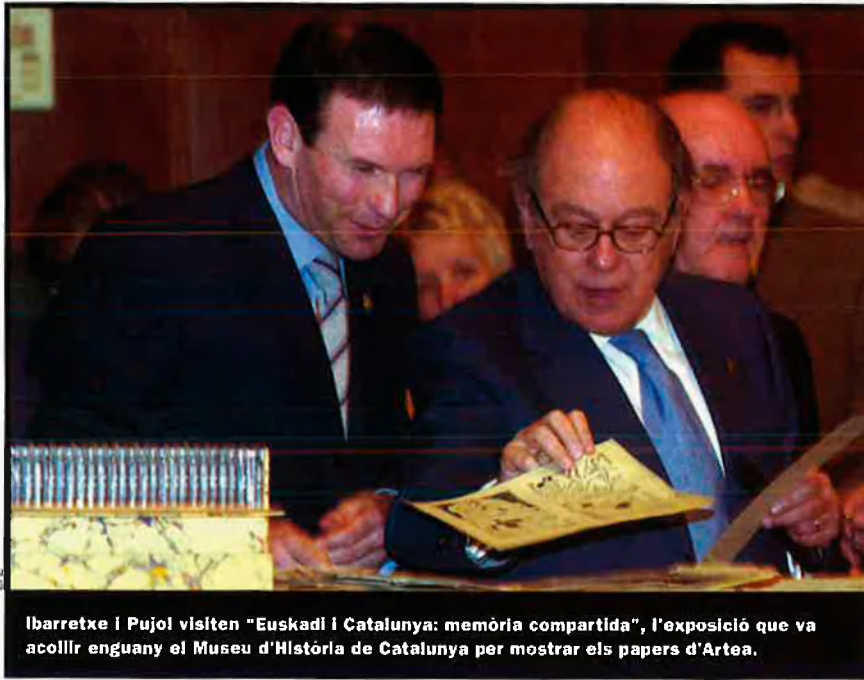
Ibarretxe i Pujol visiten "Euskadi i Catalunya: memòria compartida", l'exposició que va acollir enguany el Museu d'Història de Catalunya per mostrar els papers d'Artea.

néixer formalment el 21 de gener del 2002, després d'una reunió a l'Ateneu Barcelonès. De fet, segons explica Toni Strubell, un dels seus promotors, "són els mateixos dirigents espanyols que 'provoquen' la creació de la Comissió de la Dignitat. Els catalans no podíem quedar calladets en saber la intenció del govern d'Aznar de fer una exposició amb el nom de 'Propaganda en guerra' amb els nostres documents a Salamanca! Era un clar cas d'humiliació —un més— de la voluntat dels catalans". Aquesta exposició, programada dins els actes de la capitalitat europea de la cultura que enguany Salamanca comparteix amb Bruges, ha estat el detonador de la darrera activació d'un conflicte que no ha deixat de plantejar-se des que l'estat espanyol va encetar el camí de l'actual democràcia constitucional. Només que, aquest 2002, ha pres una dimensió que ha superat expectatives: ja de bon començament els mateixos impulsors de la Comissió de la Dignitat es van sorprendre de la resposta que va tenir la seva crida. I en això, els sentiments hi han tingut el seu paper, és clar. Però no s'ha oblidat la necessària col·laboració d'experts del més alt nivell científic i professional. I tot, amb la voluntat de recollir, com expliquen els organitzadors, "la feina ja