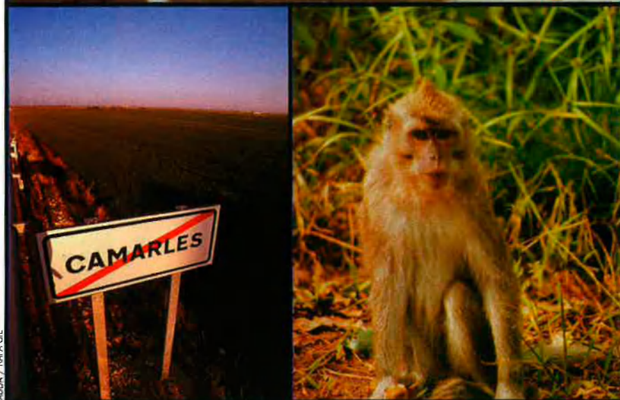
Són imatges de macacos preses a les Illes Maurici. Des d'allí, els duran a Camarles, poble en el qual viuran més mones que humans.

grafies que ADDA ha cedit a aquest reportatge, i que, segons aquesta associació, han estat preses a Maurici, allà hi ha macacos. “Només conserven les femelles; dels mascles, se'n desfan, excepte dels que conserven com a sementals”, indica Cases. “Ara poden criar-los en el centre de les Illes Maurici, però en un moment o altre haurien de matar els progenitors, perquè, per agafar una cria, això és necessari.” I per què fan servir només cries? “Lògicament, són més fàcils de tractar”, indica Cases.