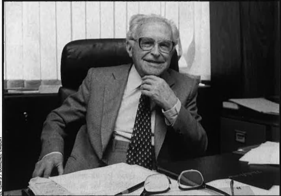
EL TEMPS / DOMÈNEC UMBERT