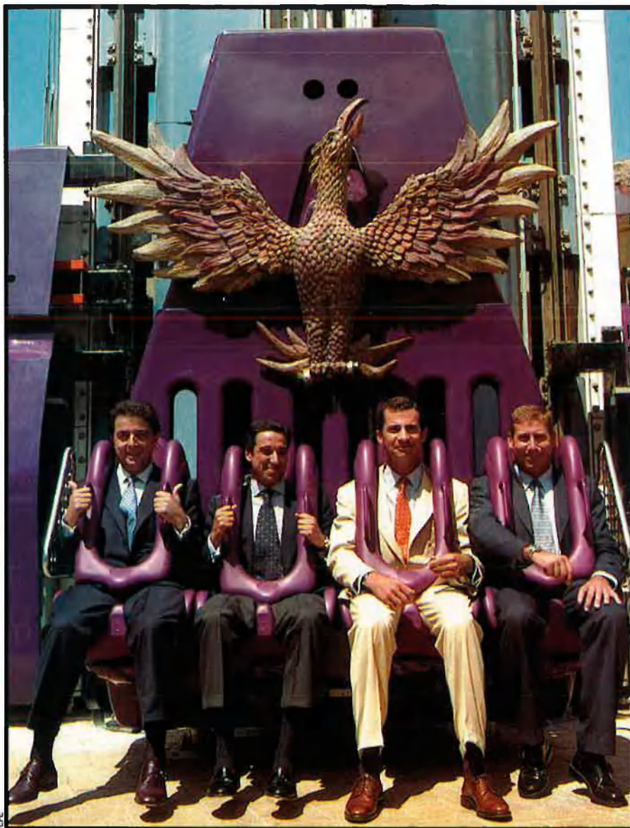
Inauguració de Terra Mítica. El ja expresident valencià ha escampat magnes complexos lúdics arreu del País Valencià. Els recursos, econòmics o mediambientals, no li han importat.