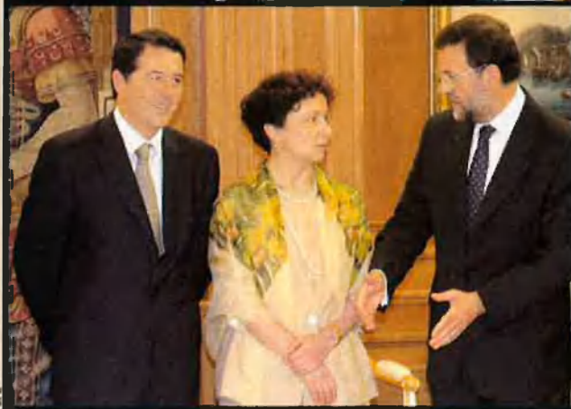
A dalt, manifestació de l'orgull gal. No buscu a Vizcaino Casas aci, perquè ell s'ha buriat d'aquesta reivindicació festiva pública. Una singular entrada per a un singular membre del Consell Valencià de Cultura. A baix, Ana de Palacio, recentment nomenada ministra d'Afers Estrangers. Ella serà l'encarregada de desembolicar l'episodi tan ridícul de l'illa del Perejil.

illencs, en una temporada –i any– bastant dolent a causa de la crisi a Alemanya i de l'augment de preus derivat de l'euro. Aquests dos factors han comportat una disminució del turisme alemany a Balears, de manera que les xifres globals d'ocupació són d'un 10% –com a mínim– menors que les de l'any passat. Que ens envaeixen els marroquins! Dijous a la matinada. Salten les alarmes al Ministeri d'Afers Exteriors en assabentar-se que membres de les forces armades marroquines han instal·lat dues tendes de campanya i dues banderes del regne del Marroc a l'illa del Perejil. L'illa en qüestió es tracta d'un enclavament sota sobirania espanyola situat a unes sis milles de la costa de Ceuta, de dimensions similars a les d'un camp de futbol. El Govern espanyol demana la retirada dels seus homes al Govern marroquí.