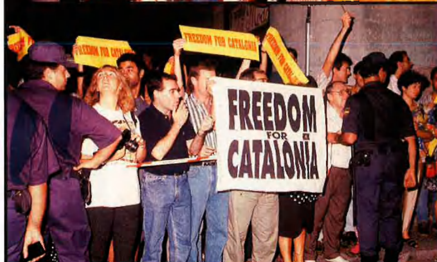
Les Ollmpriades del 1992 eren l'aparador ideal per a transmetre al món el missatge independentista. La severa actuació policial va augmentar la protesta. El Palau de la Música Catalana s'ompli per a demanar la llibertat dels detinguts, en un acte que evocava l'antifranquisme.

CARME PUERTOLAS / JORDI MOREIRA / VÍCTOR NAVARRO